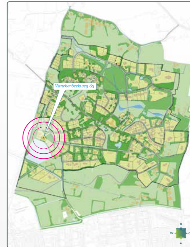
Ligging van z79 in 't Vaneker